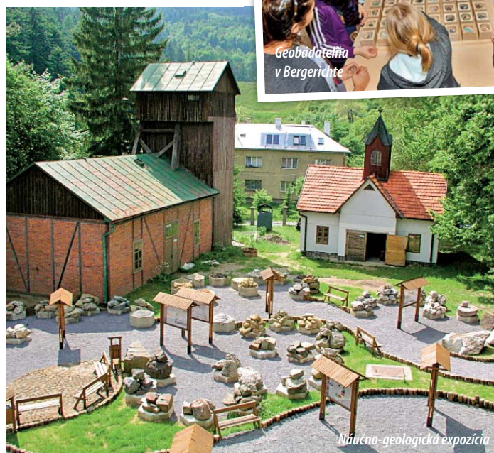
Geobádateľňa v Bergerichte

toch a náučných trasách umiestnené v priestoroch informačného centra v Banskej Štiavnici a, samozrejme, zážitok z podzemia poskytuje fária- nie do štôlne Bartolomej a dedič- nej štôlne Glanzenberg. Myšlienka uchovávať hmotné a duchovné dedičstvo a prezentovať ho netra- dičným zážitkovým spôsobom sa realizuje pod hlavičkou projektu Škola v múzeu , ktorého aktivity sa realizujú formou tvorivých dielní, kurzov, prezentácií, podujatí (Letné prázdninové tvorivé dielne, Hara- burdy alebo bazar (ne)potrebných vecí, Deň vody, Deň Zeme), výstav s environmentálnou tematikou (My sa nevieme sťažovať nahlas), ale aj prostredníctvom interaktívnych prehliadok (Hádaj, čo je to?, Roz- právka o baníkovi Jožkovi, ryžova- nie zlata). Všetky aktivity slúžia ako doplnkové vzdelávanie pre žiakov materských, základných škôl a študentov stredných a vysokých škôl. Bohatá ponuka SBM sa v roku 2016 rozšírila o aktivity Interaktívne- ho múzea a Geobádateľne , ktoré vznikli ako interaktívny doplnok Mineralogickej expozície v Berg- gerichte. Aktivity sú zamerané na spoznávanie neživej prírody, hornín a minerálov všetkými vekovými kategóriami. QR kódy s interaktív- nym obsahom, 3D pexeso, zázračná žiariaca krabica, nevšedná Mendele- jeva tabuľka, unikátne pexeso, to