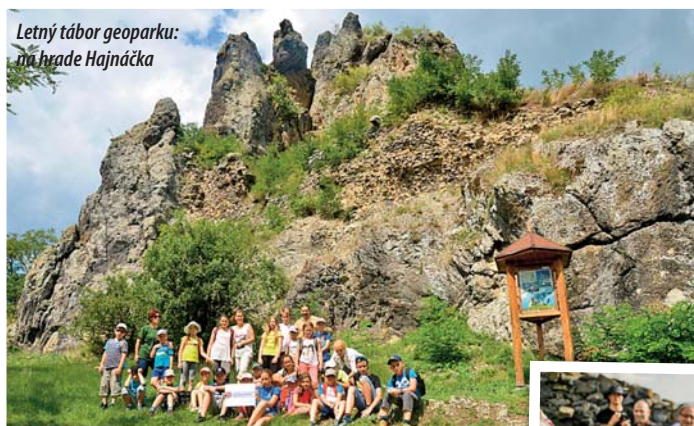
Letný tábor geoparku: na hrade Hajnáčka

V roku 2010 sa stal členom Globálnej siete geoparkov (GGN) ako prvý cezhraničný geopark na svete. V roku 2014 prešiel náročným procesom revalidácie členstva v GGN na ďalšie štyri roky. V novembri 2015 členské štáty UNESCO na svojej generálnej konferencii rozhodli o podpore geoparkov prostredníctvom Medzinárodného programu pre vedu o Zemi a geoparky, a ratifikovali vznik novej kategórie UNESCO Global Geoparks. V roku 2016 sa činnosť geoparku orientuje na rozvojové a administratívne aktivity, akými sú systematická komunikácia s obcami a s partnerskými organizáciami v území, strategické plánovanie, aktualizácia interných dokumentov, príprava projektov, vytváranie podmienok na rozvoj geoturizmu, poskytovanie sprievodcovských služieb a organizovanie pravidelných poznávacích túr, akti-