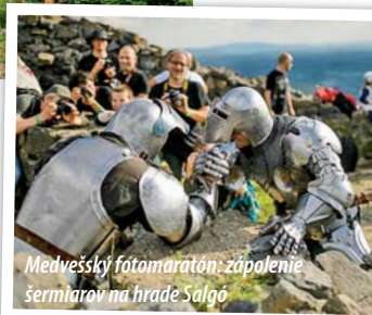
Medvešský fotomaratón: zápolenie šermiarov na hrade Salgó

Pre 28 detí vo veku od 6 do 12 rokov sa začiatkom augusta už po šiesty raz organizoval Letný tábor geoparku , v rámci ktorého deti zábavno-náučným spôsobom spoznávali hodnoty geoparku.