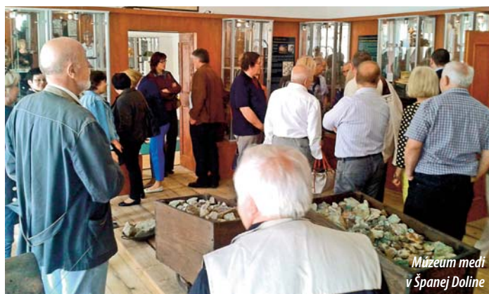
Múzeum medi v Španej Doline

z dôvodu ktorého sa tu buduje „Uhliarsky náučný chodník“. V obci Malachov a v blízkom okolí obcí Horné Pršany a Baďín vybudovalo miestne združenie chodník s prírodovedno-historicko-montanis- tickým zameraním. Uvedené obce v spolupráci s miestnymi baníckymi spolkami, združeniami, podnikateľ- mi a s inými aktivistami postupne budujú lokálne produkty spojené s prezentáciou histórie a kultúry v miestnych múzeách, ukážka- mi tavby medi z dávnej minulosti v spojení s rôznymi podujatiami. Zaujímavým projektom mesta Ban- ská Bystrica je „Banskobystrická