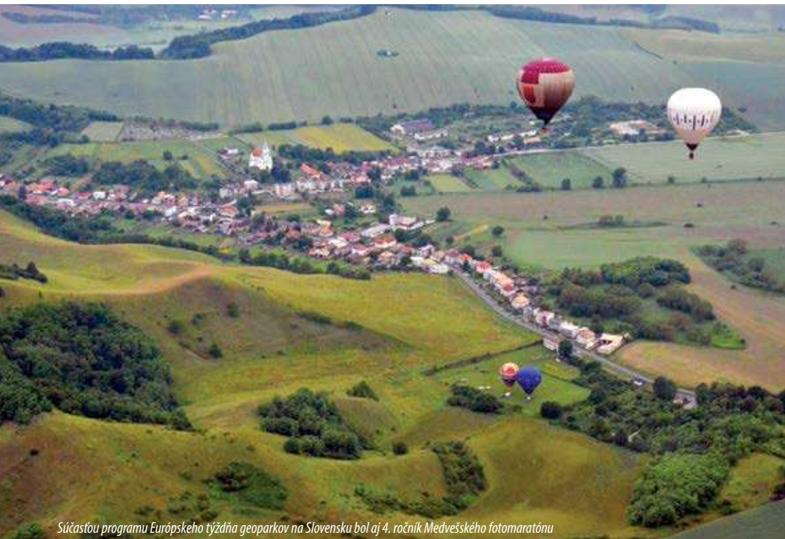
Súčasťou programu Európskeho týždňa geoparkov na Slovensku bol aj 4. ročník Medvešského fotomaratónu

Suvenírom pre geopark – Huby na území geoparku , do ktorej prišlo takmer 100 výtvarných a fotografických prác. Najpopulárnejším programom podujatia bol 4. ročník Medvešského fotomaratónu (1. – 3. júna), ktorého cieľom bolo priblížiť širokej fotografickej verejnosti menej známy región geoparku na juhu stredného Slovenska a severe Maďarska, vyznačujúci sa geologickými a prírodnými pozoruhodnosťami i bohatou históriou. Pre vyše 300 účastníkov bol pripravený 48-hodinový program, v rámci ktorého boli osvetlené stredoveké hrady (Šomoška, Filakovo, Hajnáčka, Šalgo), uskutocnené odborné workshopy a prednášky s fotografickou tematikou, lety teplovzdušným balónom, túry so sprievodcom na miesta s fotopanoramatickými výhľadmi a pod. Súčasťou podujatia bola aj fotosúťaž vyhlásená v troch kategóriách (Krajina, Ludia, Živá príroda), do ktorej ceny pre víťazov formou víkendových ubytovacích poukazov v Stredisku environmentálnej výchovy Dropie venovala aj SAŽP. Celé podujatie ukončil 8. ročník letného tábora (30. júla – 3. augusta). Počas jeho trvania získalo 34 detí od 8 do 12 rokov zaujímavé informácie o geoparkoch. Navštívili Novohradské turisticko-informačné centrum vo Filakove a Eresztvény, absolvovali túry so sprievodcom zamerané na spoznávanie neživej a živej prírody či vodného systému regiónu (Hajnáčka – Lesy pod Tiličom – Steblová skala – Hajnáčka, Hrad Šalgo), tvorivé dielne, ryžovanie zlata a bohatý kultúrno-spoločenský program.