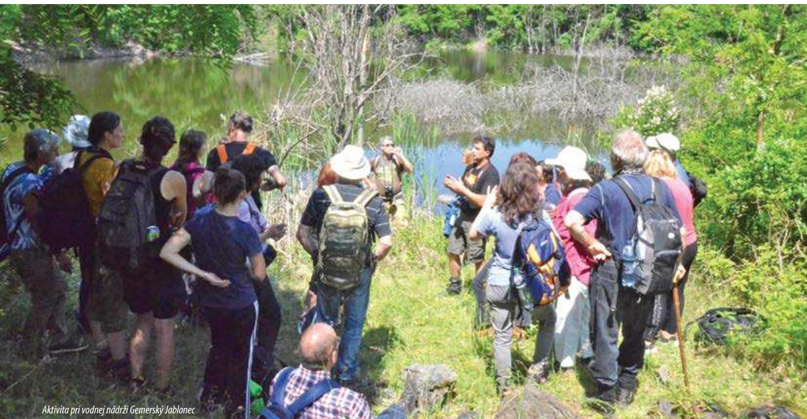
Aktivita pri vodnej nádrži Gemerský Jablonec

Banskoštiavnický geopark a Banskobystrický geopark sa v spolupráci so SAŽP zapojili do Týždňa európskych geoparkov po prvýkrát, a to prostredníctvom jednoduchých informačno-propagačných podujatí